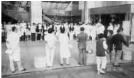
中京病院のストライキ突入集会(玄関前) 看護婦増員の訴えには患者さんも激励