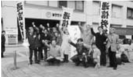
通信労組は2カ所でスト突入集会と宣伝行動 国公の仲間も激励の宣伝を

「あんな騒がしいクラスで勉強ちゃんとしてくれるんですか」父母の不安な声や子どもたちの荒れた様子に、心痛まない教師はないと思います。現場の苦悩に比べ、名古屋市の教育行政の怠慢はひどいものです。教員の新規採用数の減少で、職場の高齢化が顕著と