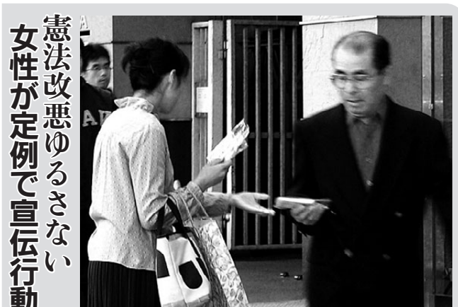
愛労連女性協と自治労連女性部は、憲法まもれと毎月第1土曜に定例宣伝。2回目となった11月5日は、名古屋市中区の栄でオリジナル宣伝グッズでアピール。

「被爆・戦後60年、憲法九条を守り核兵器の一刻も早い廃絶を」と、10月30日には名古屋市公会堂で「被爆・戦後60年企画、憲法九条の心を世界へ、ピースワールド60あいち」が開かれ、約1000人が参加しました。