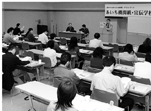
初日におこなわれた記念講演

10月18日から20日にかけて県下の自治体に対し社会保障問題でキャラバン。写真は岡崎市への要請