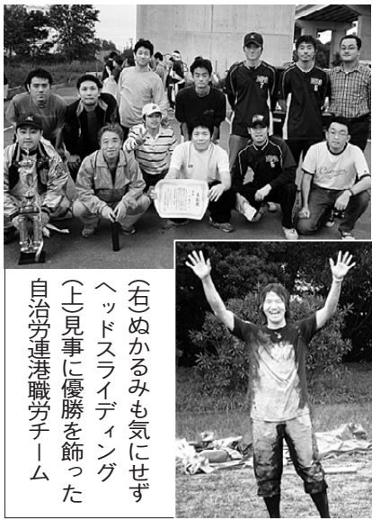
(右)めぐるみも気にせずヘッドスライディング (上)見事に優勝を飾った自治労連港職労チーム

あいにくの天気となった10月10日、名古屋港木場南公園で愛労連青年協主催のソフトボール大会が開かれました。9単産10チーム、140人を超える参加者は、2年ぶりの大会に気合い満々。揃いのTシャツを泥まみれにしてスライディングする選手、足もの悪さをしみながら軽快な動きを見せる選手など様々な姿がありました。昼休みにバレーキューを楽しむチームやお弁当を囲んで交流する家族などが各所に見られ、出店の食べ物も完売の大盛況。夕方まで続いた熱戦は攻守ともにバランスのとれた自治労連・港職労チームが制して優勝。全医労・東尾張支部チームが準優勝でした。