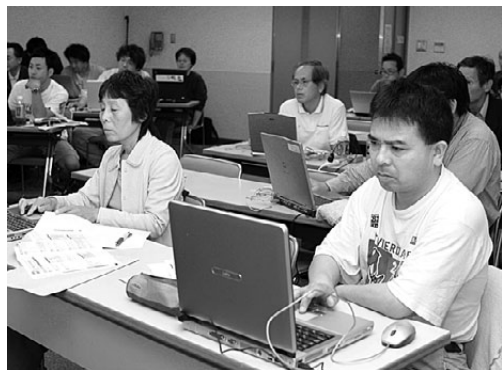
パソコンで新聞づくり講座で、パソコンと格闘する参加者