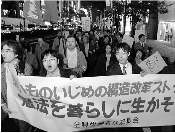
元気にシュプレヒコールをあげながら矢場町までデモ行進