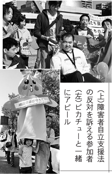
(上)障害者自立支援法の反対を訴える参加者 (左)ピカチュウと一緒にアピール

秋晴れの青空が広がった10月30日、名古屋市中区の白川公園で「福祉予算削減な！福祉を金もうけにするな！10・30愛知県民集会」が同実行委員会によっておこなわれ、1000人を超えてる人々が集まりました。会場には工夫をこらした横断幕やデコレーションであふれ、厳しい情勢の中でも楽しく華やかにアピールしました。戦後60年、改憲の危機にさらされている憲法九条を守ろうと訴えるものも目立ちました。 集会後、買い物客でにぎわう栄までのデモ行進。障害者自立支援法の採決を翌日に控え、障害者団体を中心に「福祉は買うものではない」と大きく声をあげ、チラシを配りながらパレードしました。 参加者からは「社会保障をめぐる情勢は厳しいけれど、ここに集まった人たちの熱気に確信を持った。また明日からも頑張る元気が出た」などの声がよせられていました。