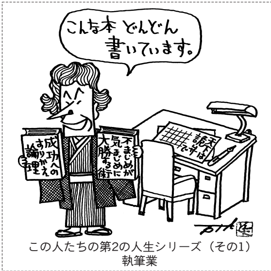
この人たちの第2の人生シリーズ（その1） 執筆業

二日目は、新聞やビラづくり、デジタルカメラ、パソコンなどの五つの内容に分かれた実践講座でスキルアップを図りました。